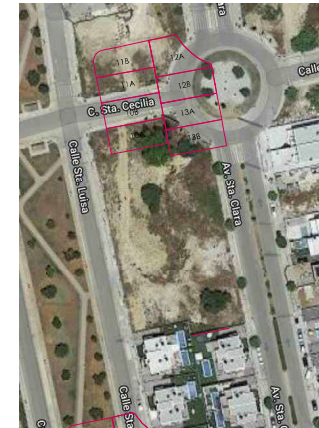
Situación de la Parcela (Fuente Google Earth)