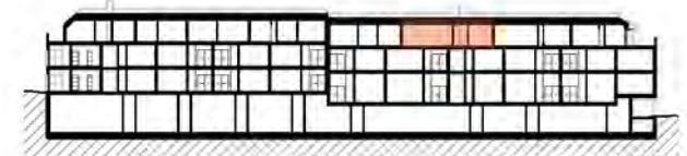
SITUACIÓN EN ALZADO

Las superficies indicadas están calculadas conforme al Decreto 218/2005 de información al consumidor en la compra y arrendamiento de viviendas.