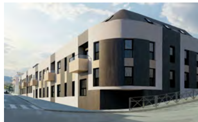
IMÁGENES ORIENTATIVAS. ANTEPROYECTO SUJETO A MODIFICACIONES

El presente documento tiene carácter meramente informativo y podrá experimentar variaciones por exigencias jurídicas y/o municipales. Todo el mobiliario, incluido el de la cocina, es meramente informativo. Los giros de puerta y distribución de los aparatos sanitarios no son vinculantes. Las superficies expresadas son aproximadas, pudiendo experimentar modificaciones por razones de índole técnica en el desarrollo de la ejecución de las obras.