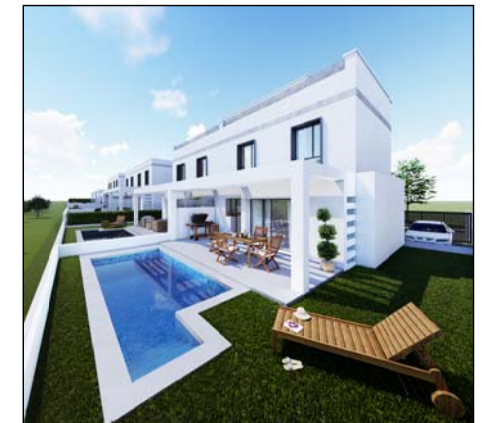
VISTA POSTERIOR VIVIENDA

El presente documento tiene carácter meramente informativo y podrá experimentar variaciones por exigencias jurídicas y/o municipales. Todo el mobiliario, incluido el de la cocina, es meramente informativo. Los giros de puerta y distribución de los aparatos sanitarios no son vinculantes. Las superficies expresadas son aproximadas, pudiendo experimentar modificaciones por razones de índole técnica en el desarrollo de la ejecución de las obras.