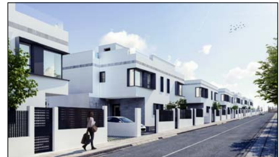
VISTA DESDE LA CALLE