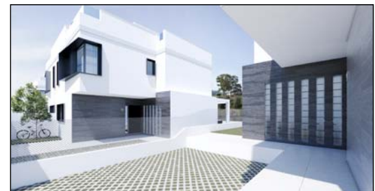
VISTA ENTRADA VIVIENDA